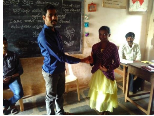
ಸ್ಪರ್ಧಾ ಕಾರ್ಯಕ್ರಮದಲ್ಲಿ ಬಹುಮಾನ ಸ್ವೀಕರಿಸುತ್ತಿರುವ ವಿದ್ಯಾರ್ಥಿಗಳು

2017- 18 ನೇ ಸಾಲಿನ ನಿಕಟಪೂರ್ವ ತರಬೇತಿಯ ಸಂದರ್ಭದಲ್ಲಿ ವಿವಿಧ ಶಾಲೆಗಳ 5, 6 ಮತ್ತು 7ನೇ ತರಗತಿ ವಿದ್ಯಾರ್ಥಿಗಳಿಗೆ ದಿನ ಬಳಕೆಯ ವಸ್ತುಗಳ ಬರವಣಿಗೆಯ ಸ್ಪರ್ಧಾ ಕಾರ್ಯಕ್ರಮವನ್ನು ಹಮ್ಮಿಕೊಳ್ಳಲಾಗಿತ್ತು. ಎಲ್ಲಾ ಶಾಲೆಗಳ ವಿದ್ಯಾರ್ಥಿಗಳು ಉತ್ಸಾಹದಿಂದ ಪಾಲ್ಗೊಂಡು ಬಹುಮಾನಗಳನ್ನು ಪಡೆದುಕೊಂಡರು. ಕಾರ್ಯಕ್ರಮದಲ್ಲಿ ಪ್ರಾಧ್ಯಾಪಕರು, ಶಿಕ್ಷಕರು ಮತ್ತು ಪ್ರಶಿಕ್ಷಣಾರ್ಥಿಗಳು ಉಪಸ್ಥಿತರಿದ್ದರು.