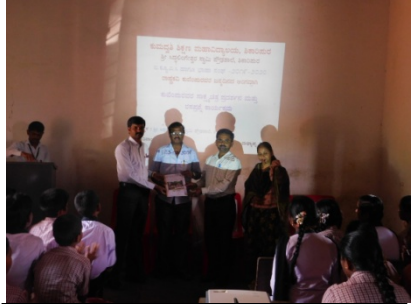
ಶಾಲೆಯ ಮುಖ್ಯೋಪಾಧ್ಯಾಯರಿಗೆ ಕಾಲೇಜಿನ ವತಿಯಿಂದ ನೆನಪಿನ ಕಾಣಿಕೆ ನೀಡುತ್ತಿರುವುದು