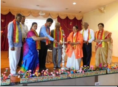
ಕಾರ್ಯಕ್ರಮದ ಉದ್ಘಾಟನೆಯನ್ನು ನೆರವೇರಿಸುತ್ತಿರುವ ಗಣ್ಯರು