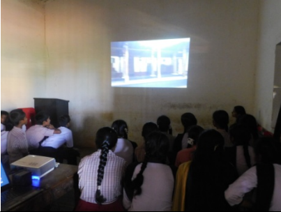
ಸಾಕ್ಷ್ಯಚಿತ್ರ ಪ್ರದರ್ಶನವನ್ನು ಶಾಲೆಯ ಶಿಕ್ಷಕರು ಹಾಗೂ ವಿದ್ಯಾರ್ಥಿಗಳು ವೀಕ್ಷಿಸುತ್ತಿರುವುದು.

'ಕವಿಮನೆ ಯಾನ' ಮತ್ತು 'ಕಾಡಿನ ಕವಿ' ಸಾಕ್ಷ್ಯಚಿತ್ರಗಳ ಪ್ರದರ್ಶನ ಮತ್ತು ರಸಪ್ರಶ್ನೆ ಕಾರ್ಯಕ್ರಮ