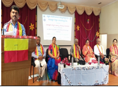
ಕಾರ್ಯಕ್ರಮದಲ್ಲಿ ಸನ್ಮಾನ್ಯಶ್ರೀ ಬಿ. ವೈ ರಾಘವೇಂದ್ರ ಉದ್ಘಾಟನಾ ನುಡಿಗಳನ್ನಾಡುತ್ತಿರುವುದು