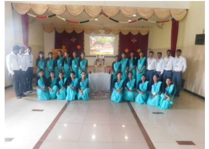
ಭಾವಚಿತ್ರಕ್ಕೆ ಪುಷ್ಪಾರ್ಚನೆಯನ್ನು ನೆರವೇರಿಸಿದ ತೃತೀಯ ಸೆಮಿಸ್ಟರ್ ಪ್ರಶಿಕ್ಷಣಾರ್ಥಿಗಳು

ದಿನಾಂಕ 29-12-2019 ರ ಭಾನುವಾರ ಬೆಳಿಗ್ಗೆ 09:00 ಗಂಟೆಗೆ ಐ.ಕ್ಯೂ.ಎ.ಸಿ ಹಾಗೂ ಭಾಷಾ ಸಂಘ – 2019-20 ರ ಅಡಿಯಲ್ಲಿ ರಾಷ್ಟ್ರಕವಿ ಕುವೆಂಪುರವರ 115ನೇ ಜನ್ಮ ದಿನಾಚರಣೆ ಕಾರ್ಯಕ್ರಮವನ್ನು ಏರ್ಪಡಿಸಲಾಗಿತ್ತು. ಈ ಕಾರ್ಯಕ್ರಮದಲ್ಲಿ ಕುವೆಂಪುರವರು ಸಾಹಿತ್ಯ ಕ್ಷೇತ್ರಕ್ಕೆ ಸಲ್ಲಿಸಿದ ಅಮೋಘ ಸಾಧನೆಗಳನ್ನು ತಿಳಿಸುವ ಕೆಲಸ ಮಾಡಬೇಕಾಗಿರುವುದರಿಂದ ಇವರ ಕೊಡುಗೆಯಾಧಾರಿಸಿ “ವಿಶ್ವ ಮಾನವ ದಿನಾಚರಣೆ” ಯನ್ನಾಗಿ ಆಚರಿಸಲಾಯಿತು.