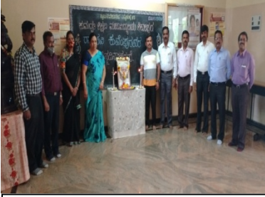
ರಾಷ್ಟ್ರಕವಿ ಕುವೆಂಪುರವರ ಭಾವಚಿತ್ರಕ್ಕೆ ಪುಷ್ಪ ನಮನ ಕೈಗೊಳ್ಳಲಾಯಿತು.