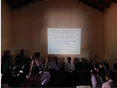
ಸಾಕ್ಷ್ಯಚಿತ್ರ ವೀಕ್ಷಣೆಯ ನಂತರ ರಸಪ್ರಶ್ನೆಗಳಿಗೆ ಪ್ರಶ್ನೋತ್ತರ ಕಾರ್ಯಕ್ರಮದಲ್ಲಿ ಪಾಲ್ಗೊಂಡಿರುವುದು