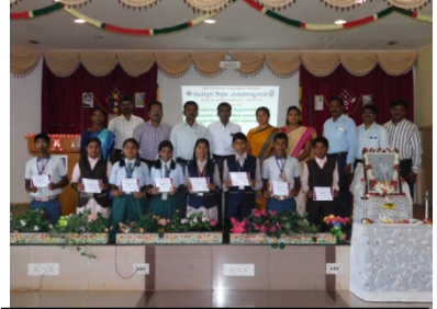
ಕಾರ್ಯಕ್ರಮದಲ್ಲಿ ಭಾಗವಹಿಸಿದ ವಿಜೇತರಾದ ವಿದ್ಯಾರ್ಥಿಗಳು ಬಹುಮಾನ ಮತ್ತು ಪ್ರಮಾಣಪತ್ರ ನೀಡಲಾಯಿತು.