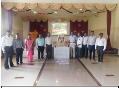
ಕುವೆಂಪುರವರ ಭಾವಚಿತ್ರಕ್ಕೆ ಪುಷ್ಪಾರ್ಚನೆಯನ್ನು ನೆರವೇರಿಸಿದ ಬೋಧಕ ಬೋಧಕೇತರ ವರ್ಗದವರು