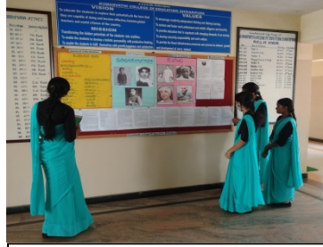
ರಾಷ್ಟ್ರಕವಿ ಕುವೆಂಪುರವರ ಸೂಚನಾ ಫಲಕದಲ್ಲಿ ಅನಾವರಣ ಮಾಡಲಾದ ಲೇಖನವನ್ನು ಪ್ರಶಿಕ್ಷಣಾರ್ಥಿಗಳು ಓದುತ್ತಿರುವುದು.