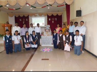
ಕಾರ್ಯಕ್ರಮದಲ್ಲಿ ಸ್ವಾಮಿ ವಿವೇಕಾನಂದರ ಭಾವಚಿತ್ರಕ್ಕೆ ಪುಷ್ಪಾರ್ಚನೆ ನೆರವೇರಿಸುತ್ತಿರುವುದು

ಸ್ವಾಮಿ ವಿವೇಕಾನಂದರ 158ನೇ ಜನ್ಮದಿನಾಚರಣೆ ಹಾಗೂ ರಾಷ್ಟ್ರಕವಿ ಕುವೆಂಪುರವರ ಜನ್ಮದಿನಾಚರಣೆಯ ಅಂಗವಾಗಿ ಪ್ರೌಢ ಶಾಲಾ ವಿದ್ಯಾರ್ಥಿಗಳಿಂದ ಸ್ವರಚಿತ ಕವನ ವಾಚನಾ ಸ್ಪರ್ಧಾ ಕಾರ್ಯಕ್ರಮ