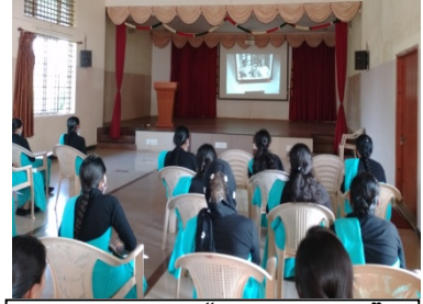
ಪ್ರಶಿಕ್ಷಣಾರ್ಥಿಗಳು “ಕವಿಮನೆ ಯಾನ” ಸಾಕ್ಷ್ಯಚಿತ್ರ ವೀಕ್ಷಿಸುತ್ತಿರುವುದು.