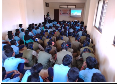
ವಿದ್ಯಾರ್ಥಿಗಳು ಕಾರ್ಯಕ್ರಮದಲ್ಲಿ ಕುವೆಂಪುರವರ ಜೀವನ ಮತ್ತು ಸಾಧನೆಗೆ ಪೂರಕವಾದ ವೀಡಿಯೋವನ್ನು ವೀಕ್ಷಿಸುತ್ತಿರುವುದು

ದಿನಾಂಕ 20-02-2020 ರ ಗುರುವಾರ ಬೆಳಿಗ್ಗೆ 10:00ಕ್ಕೆ ಕುಮದ್ವತಿ ಶಿಕ್ಷಣ ಮಹಾವಿದ್ಯಾಲಯದ ಐಕ್ಯೋಪಿಸಿ ಹಾಗೂ ಭಾಷಾ ಸಂಘ – 2019-20 ರ ಅಡಿಯಲ್ಲಿ ಶಾಲಾ ವಿದ್ಯಾರ್ಥಿಗಳಿಗಾಗಿ ರಾಷ್ಟ್ರಕವಿ ಕುವೆಂಪುರವರ ಜೀವನ ಮತ್ತು ಸಾಧನೆಯಾಧಾರಿತ “ಕವಿಮನೆ ಯಾನ” ಮತ್ತು “ಕಾಡಿನ ಕವಿ” ಸಾಕ್ಷ್ಯಚಿತ್ರ ಪ್ರದರ್ಶನ ಕಾರ್ಯಕ್ರಮವನ್ನು ಸರ್ಕಾರಿ ಮೆಟ್ರಿಕ್ ಪೂರ್ವ ವಿದ್ಯಾರ್ಥಿ ನಿಲಯ, ಹಾರೋಗೊಪ್ಪದಲ್ಲಿ ಹಮ್ಮಿಕೊಳ್ಳಲಾಗಿತ್ತು. ಈ ಕಾರ್ಯಕ್ರಮದಲ್ಲಿ ಸರ್ಕಾರಿ ಪ್ರೌಢಶಾಲೆ ಮತ್ತು ಸರ್ಕಾರಿ ಹಿರಿಯ ಪ್ರಾಥಮಿಕ ಶಾಲೆಯ ಸಿಬ್ಬಂದಿಗಳು, ವಿದ್ಯಾರ್ಥಿಗಳು ಸಾಕ್ಷ್ಯಚಿತ್ರಗಳನ್ನು ಆಸಕ್ತಿಯಿಂದ ವೀಕ್ಷಿಸಿದರು.