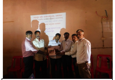
ಕಾರ್ಯಕ್ರಮದಲ್ಲಿ ಕುವೆಂಪುರವರ ಜೀವನ ಮತ್ತು ಸಾಧನೆಗೆ ಪೂರಕವಾದ ಕೈಪಿಡಿಯನ್ನು ನೀಡಲಾಯಿತು.