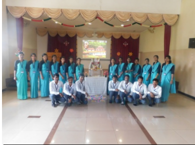
ಭಾವಚಿತ್ರಕ್ಕೆ ಪುಷ್ಪಾರ್ಚನೆಯನ್ನು ನೆರವೇರಿಸಿದ ಚತುರ್ಥ ಸೆಮಿಸ್ಟರ್ ಪ್ರಶಿಕ್ಷಣಾರ್ಥಿಗಳು